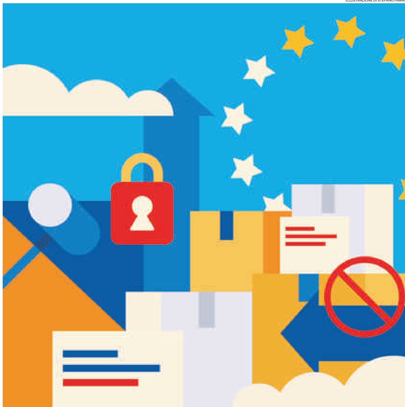
ILLUSTRAZIONE DI STEFANO MARRA

Dal Dlgs 211/2025 sui reati contro le restrizioni Ue, appena entrato in vigore, alla tassa sui pacchi. Fino alle regolarizzazioni, alla compliance e alla giurisprudenza